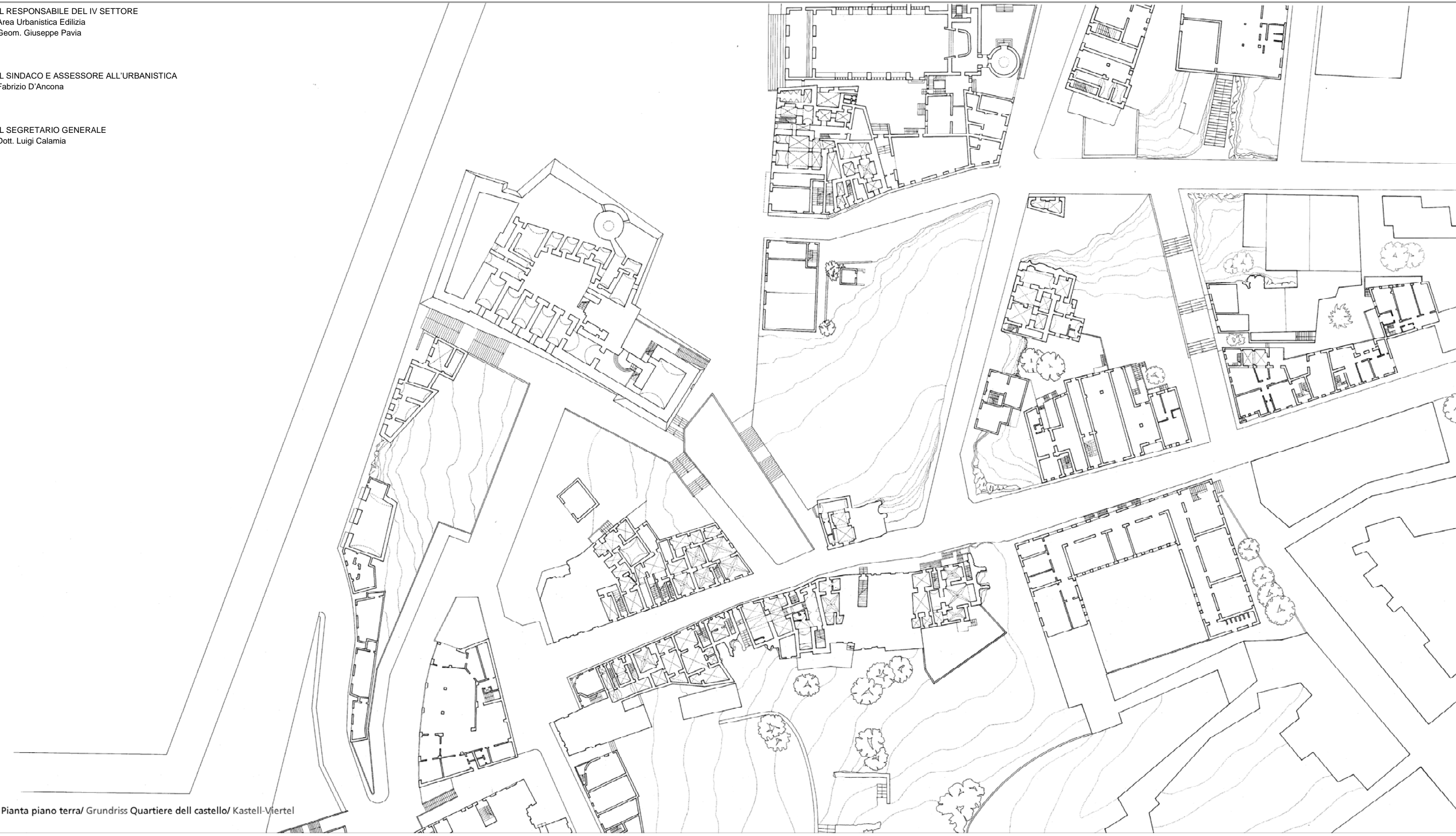
Pianta piano terra/ Grundriss Quartiere dell castello/ Kastell-Viertel