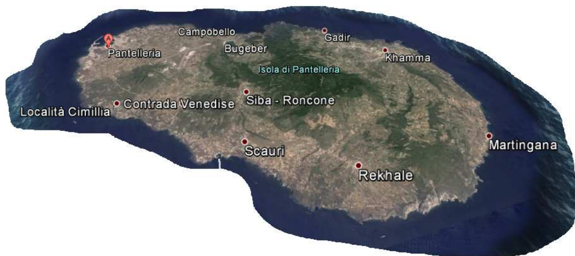
Figura 1 Area in progetto

L'area in esame del progetto riguarda il comune di Pantelleria, provincia di Trapani. La linea perimetrale che delimita l'area interessata dal progetto copre l'intera isola di Pantelleria.